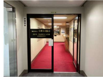
日本交通協会エントランス