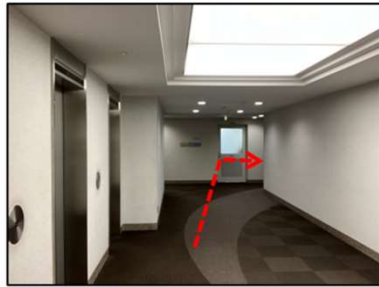
EVホール (一社)日本交通協会