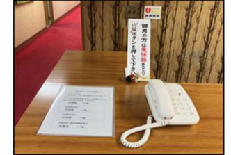
管理課「20番」で お呼び出し下さい